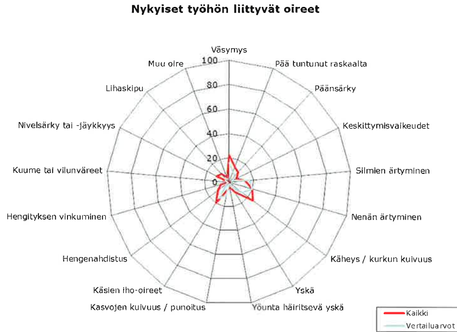
Kuva 2. Tilojen käyttäjien ilmoittamat työhön liittyvät oireet ("työhön liittyviä oireita joka viikko viimeisten kolmen kuukauden aikana").